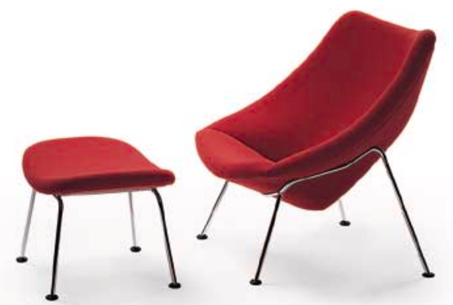
F 157 Oyster Chair