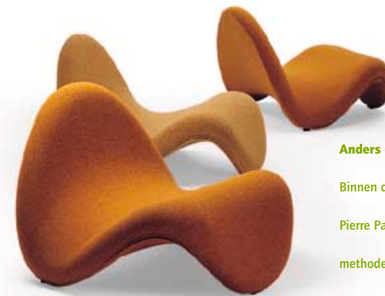
F 577 Tongue Chair

Begin jaren zestig: Andy Warhol introduceert de controversiële Pop Art, Brigitte Bardot vertolkt de vrije seksualiteit en de Rolling Stones schokken de wereld met hun rebelse act. In dat inspirerende klimaat ontwerpt Pierre Paulin voor Artifort een serie non-conformistische fauteuils, die het aanzien van onze inrichting voorgoed verandert. Organische levende vormen, al snel getooid met expressieve namen als Tulip, Tongue, Mushroom en Orange Slice, stoffen ons interieur eens en voor altijd af. De Classics Collection is geboren.