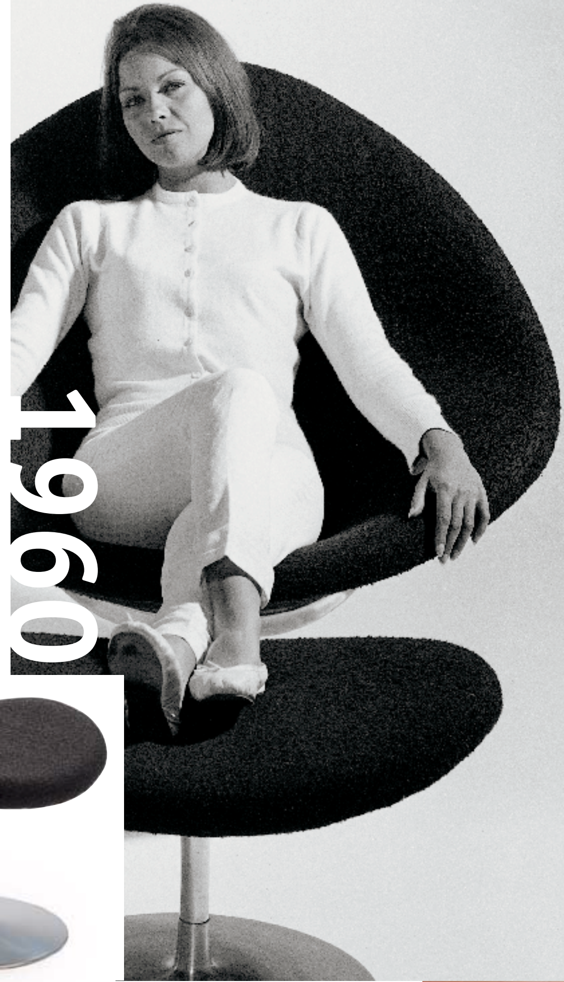
F 422 Globe Chair