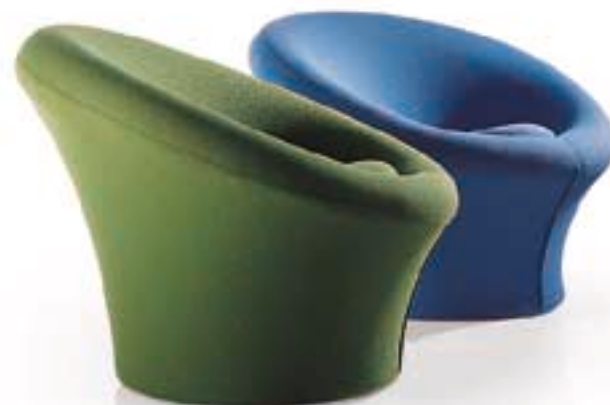
F 560 Mushroom