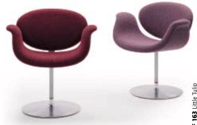
F 163 Little Tulip