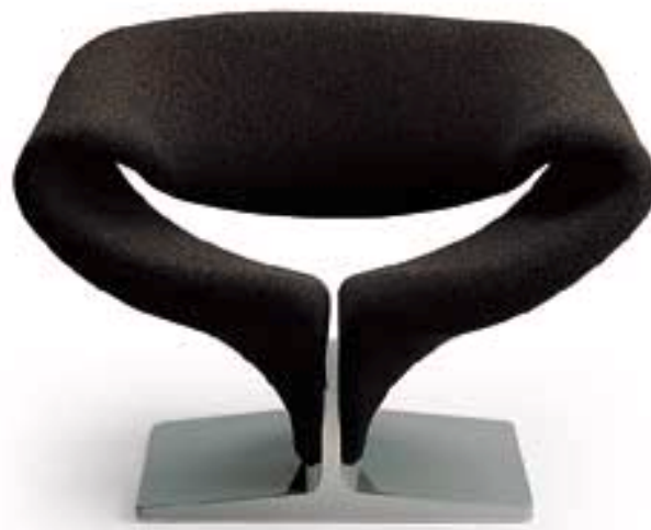
F 582 Ribbon Chair

Anfang der sechziger Jahre: Kreierte Andy Warhol einen neuen Kunststiel, die Pop Art. Brigitte Bardot lebt die freie Sexualität, die Rolling Stones schockieren die Welt mit rebellischen Auftritten. In diesem inspirierenden Klima entwarf Pierre Paulin für Artifort eine Serie von non conformistischen Möbeln, die das Erscheinungsbild unserer Einrichtungen für immer geändert haben. Organische, lebendige Formen, mit ausgefallenen Namen wie "Tulip", "Tongue", "Mushroom" und "Orange slice", die unsere Einrichtung für immer und ewig perfektionieren. Die Classicers sind geboren.